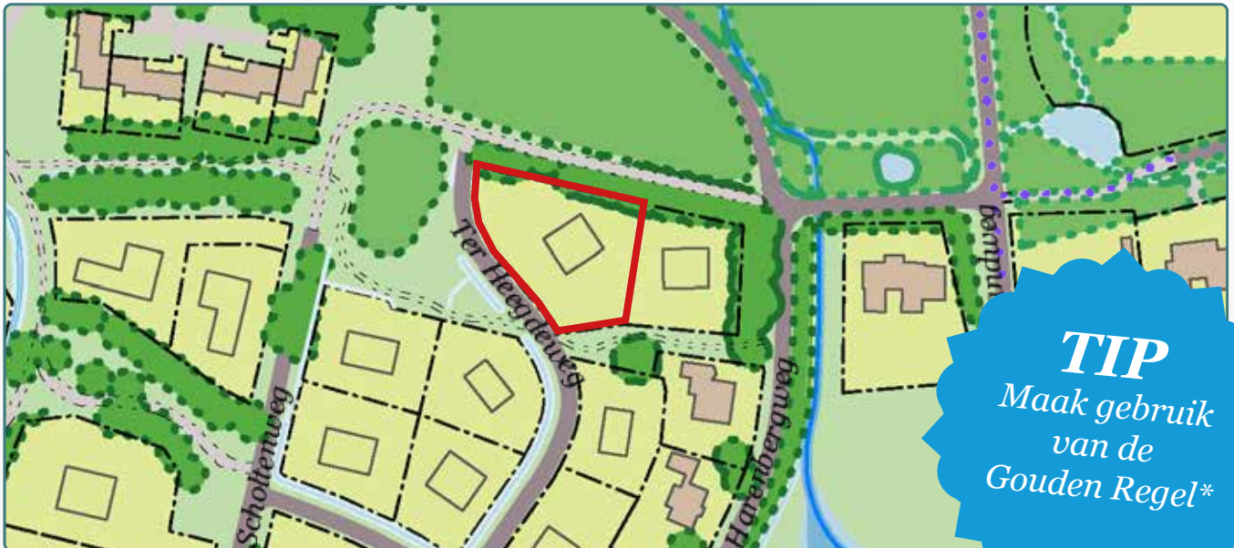
Situatietekening kavel 174