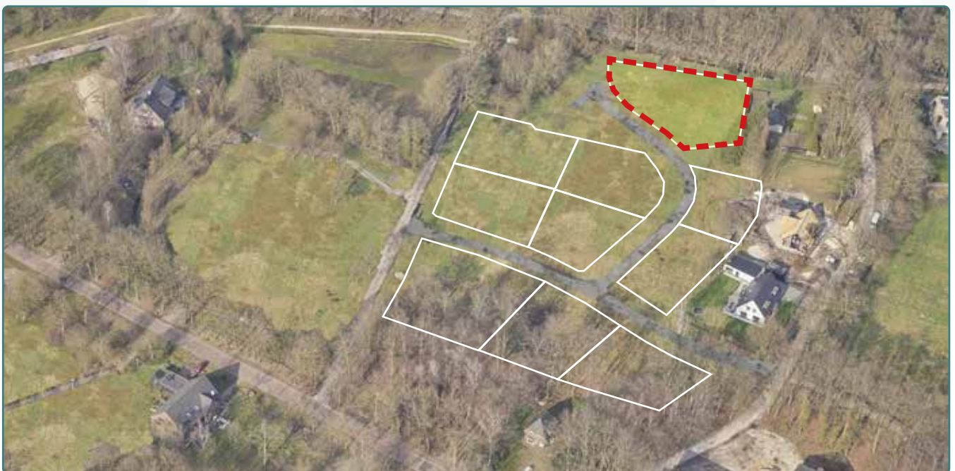
Kavel 174 vanuit de lucht